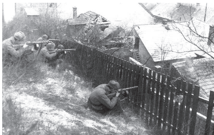
8 января 1945г. Венгрия