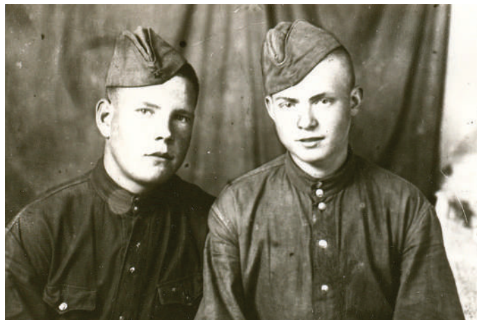
1943г. Чувашия, «учебка». Скоро на фронт

Через полчаса вражеская мина накрыла «Виллис», в котором ехал командир полка со своим адъютантом. Полковник, рассказывали, до этого дня прошёл войну без единой царапины.