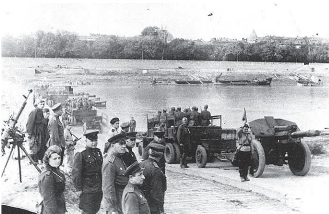
9 ноября 1944г. Дунай

– Я тебе честно скажу, комсорг, на тебя вся надежда. Больше офицеров нет. А роту надо во что бы то ни стало поднять в атаку. Понимаешь – надо! Полчаса всего продержаться, чтобы батальон успел развернуться.