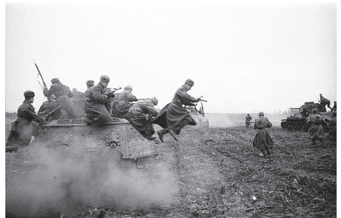
19 ноября 1944г. В атаку!