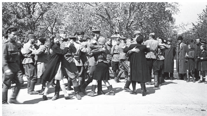
9 мая 1945г. Австрия. Победа!