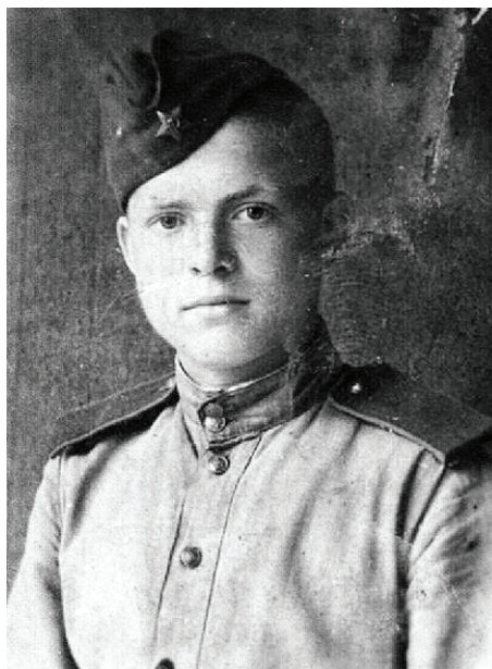
24 апреля 1944г.. Ржев. Перед отправкой на фронт