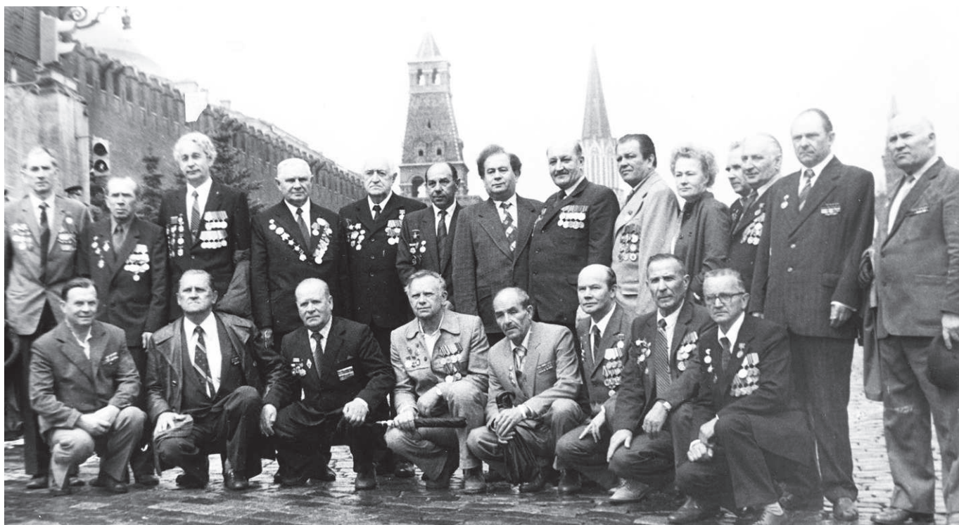
Москва, Красная площадь. 9 мая 1985 года. Всё, что осталось от знаменитой 84-й дивизии 3-го Украинского фронта. Отец на снимке крайний слева в первом ряду

Солдаты, один за другим, быстро вылезали из траншеи и осторожно ползком пробирались к редким зарослям кустарника, за которым и была та единственная, нащупанная