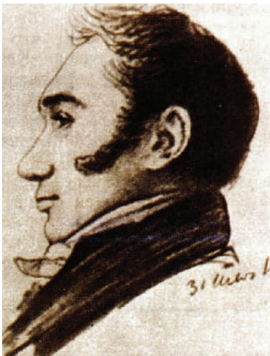
А.А. Плещеев. Рис. В.А. Жуковского