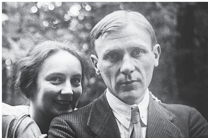
Булгаков с Белозерской

«Бывают странные сближенья! — как говаривал «Наше всё». Об одной такой весьма оригинальной ситуации, которую знаю не понаслышке, а что называется «изнутри», хочу тут рассказать.