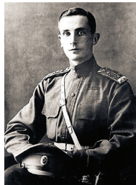
Феликс Юсупов.