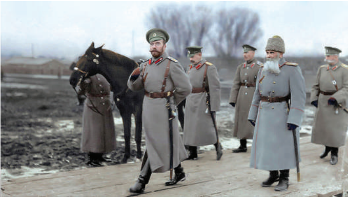
1915 год. Император Николай Второй в начале войны