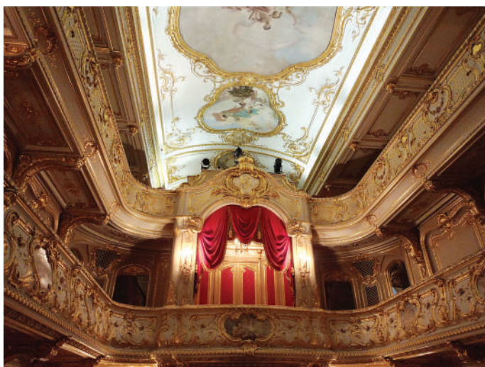
Домашний театр.

Известные артисты выступают на сцене Юсуповского дворца и сегодня. Здесь постоянно проводятся спектакли, фестивали и арт-вечера.