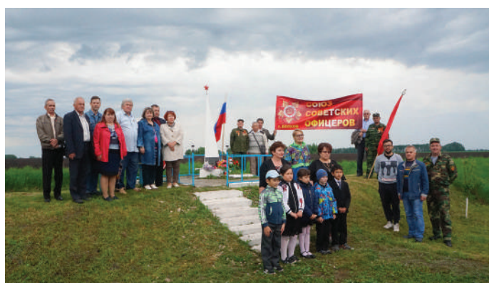
2018г. 18 мая, Болхов