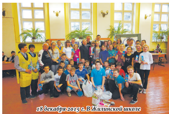
18 декабря 2015 г. В Жилинской школе