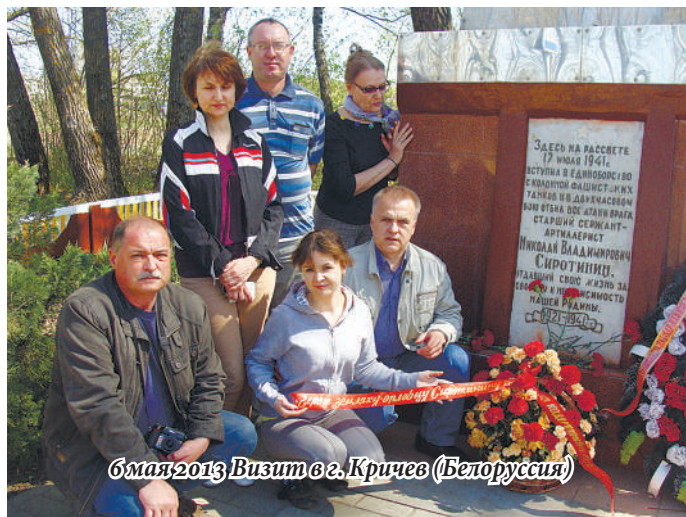
Май 2013 Визит в г. Кричев (Белоруссия)

Сын офицера-фронтовика, он никогда не прислуживал властям: его яркие критические материалы в газете "Орловский комсомолец", на областном телевидении, в федеральном издании "Советский спорт", где он десять лет проработал собственным корреспондентом по нескольким областям ЦФО, его проблемные статьи в "Новом Орле" не раз заставляли чиновников приподнимать с мягких кресел свои "авторитеты" и исправлять положение дел, поминая недобрым словом "неудобного писаку". Таких публикаций было немало, но главной