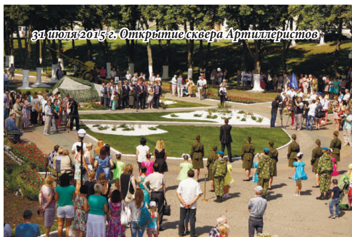
31 июля 2015 г. Открытие сквера Артиллеристов