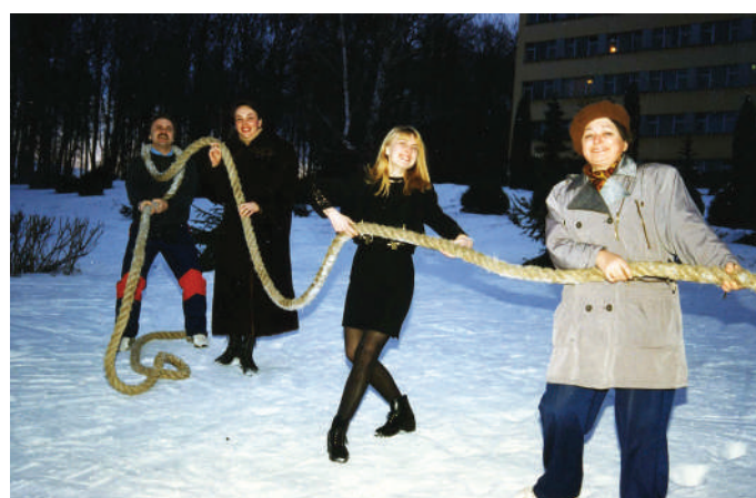
2008 г. Спартакиада журналистов в пансионате ЗИЛ