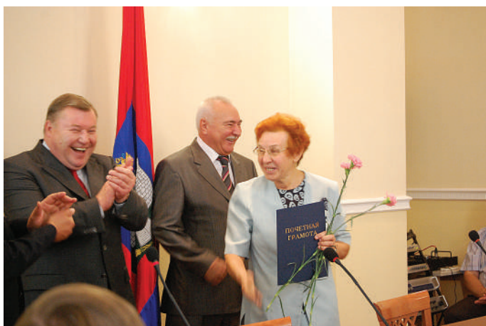
4 сентября 2009 г. Чествование в обл администрации