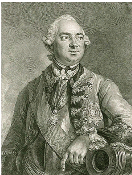
П.И. Шувалов.