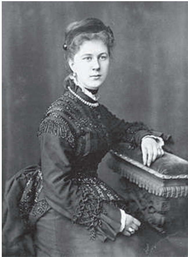
Певческий дебют. 1887, 26 апреля. Париж. 1880-е годы