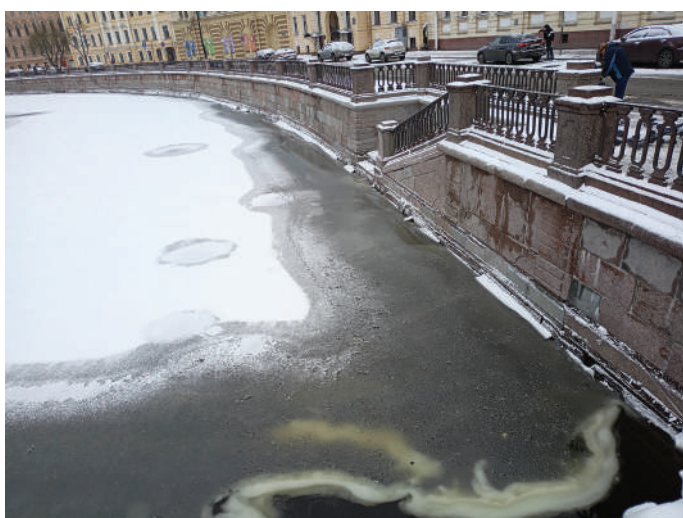
Место, где утопили Г. Распутина вместе с шубой