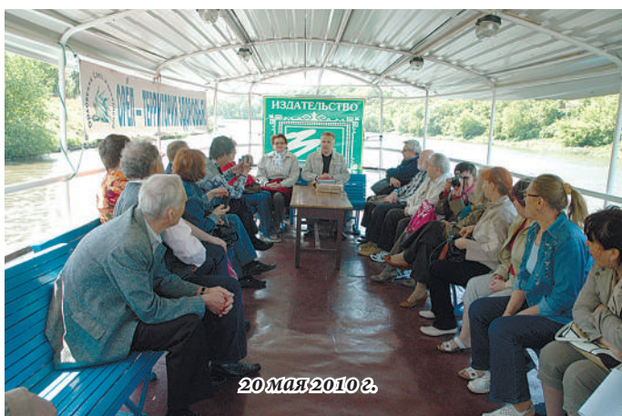
20 мая 2010 г.

шла смена губернатора, и населению был представлен Александр Козлов. Мы в редакции журнала "Новый Орёл" познакомились с его краткой официальной биографией и обратили внимание на такой факт: в мае новому главе исполнится 60 лет. По этому случаю решили представить орловцам более полный его портрет.