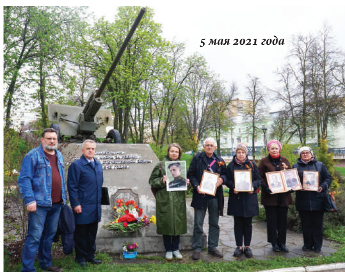
5 мая 2021 года