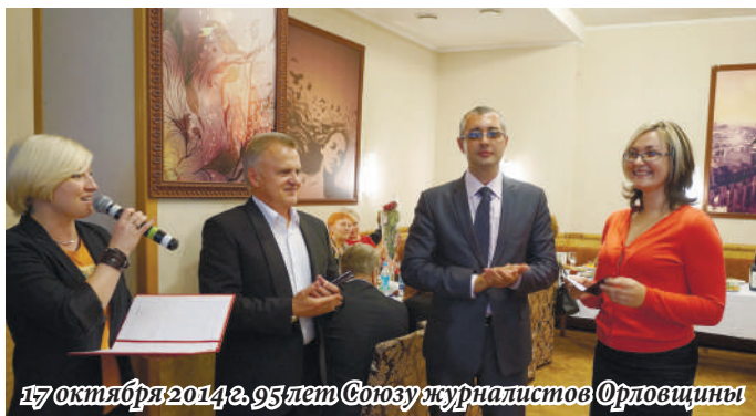
17 октября 2014 г. 95 лет Союзу журналистов Орловщины