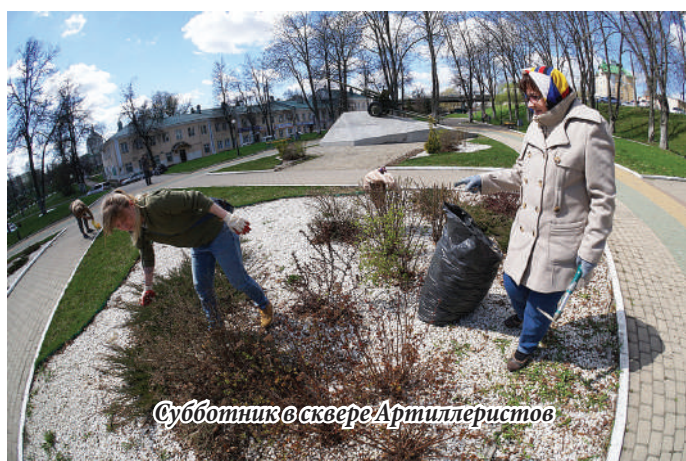
Субботник в сквере Артиллеристов