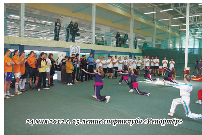
24 мая 2012 г. 15-летие спортклуба «Репортёр»