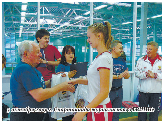
3 октября 2009 г. Спартакиада журналистов в ГРИИИИ