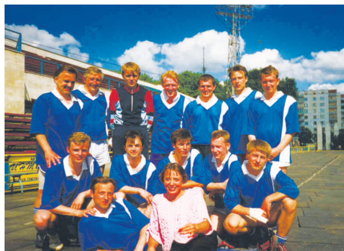
2009 г. Стали призёрами турнира репортёров в Курске