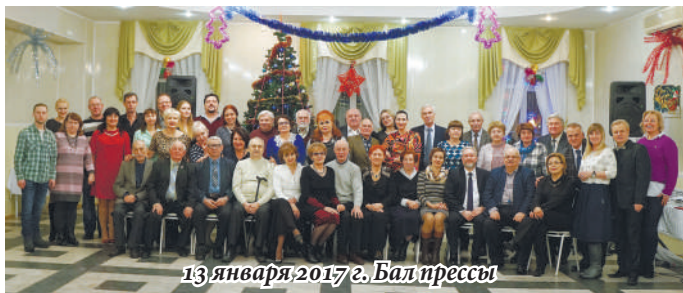
13 января 2017 г. Бал прессы