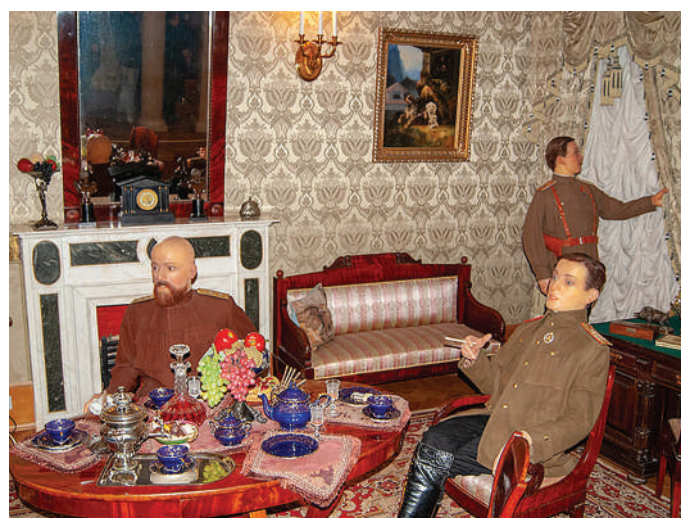
Восковые фигуры заговорщиков в подвале дворца

Юсуповский дворец выглядит почти как до революции.