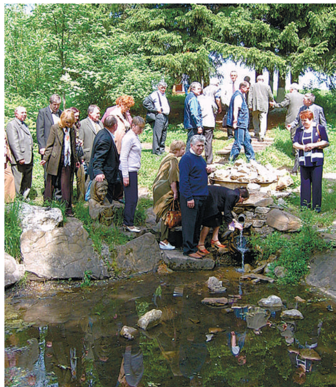
Журналисты на истоке Оки в Глазуновском районе