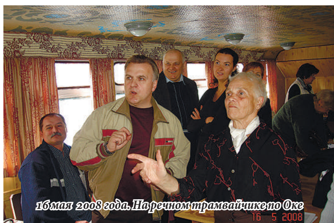
16 мая 2008 года, Нарезном трамвайчике по Оке