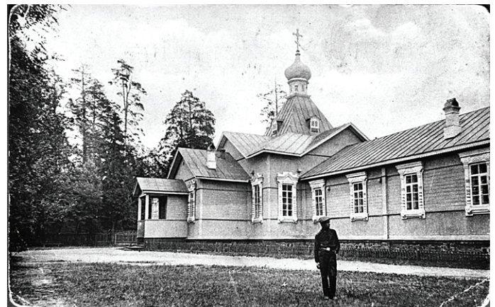
Церковь Петра и Павла в Бежице