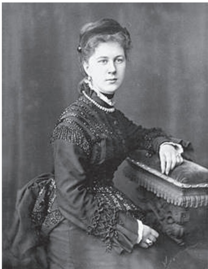
Певческий дебют. 1887, 26 апреля. Париж. 1880-е годы