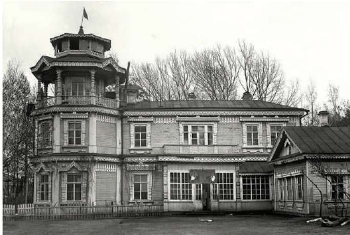
Дом Тенишевых в Майском парке в Бежице