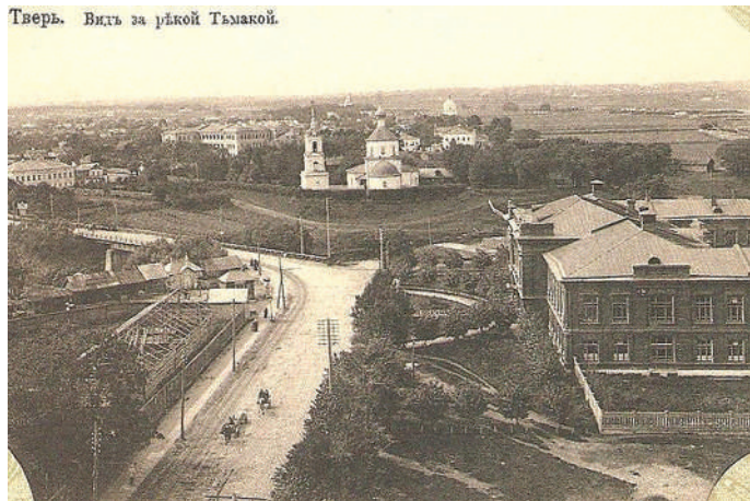
Тверь. Видь за рѣкой Тъмакой.