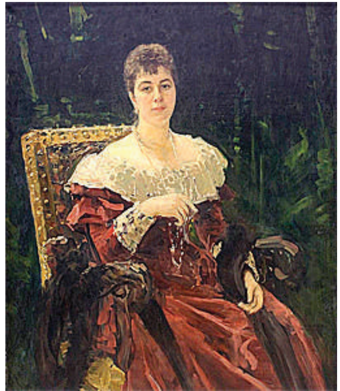
Илья Репин. Портрет М.К. Тенишевой