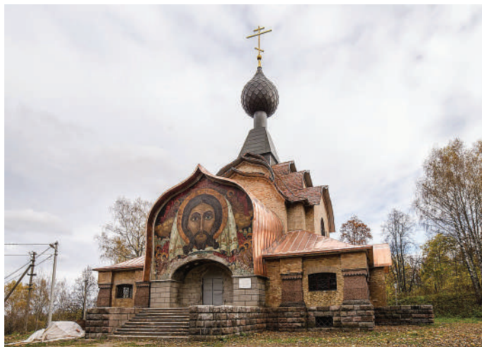
Церковь во имя Святого Духа (1903-1906) в Талашкине