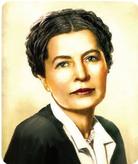
Елена Александровна БЛАГИНИНА

Родом из детства Мама спит, она устала... Ну и я играть не стала! Я волчка не завожу, А уселась и сижу. Не шумят мои игрушки, Тихо в комнате пустой. А по маминой подушке Луч крадётся золотой, И сказала я лучу: – Я тоже двигаться хочу! Я бы многого хотела: Вслух читать и мяч катать, Я бы песенку пропела, Я б могла похохотать, Да мало ль я чего хочу! Но мама спит, и я молчу. Луч метнулся по стене, А потом скользнул ко мне. – Ничего, – шепнул он будто, – Посидим и в тишине!..