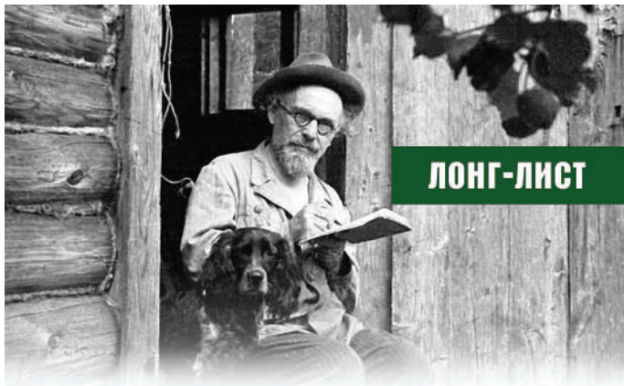
Всероссийский литературный конкурс к 150-летию М.М. Пришвина "Добром за добро!"

Завершён марафон под названием «Добром за добро!», в котором приняли участие более 400 молодых литераторов со всех уголком шестой части суши.