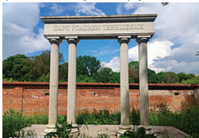
На месте усадьбы Тенишевых в Хотылёво

Добавим, что главным делом жизни Марии Клавдиевны было просветительство. Ею было создано, помимо Училища ремесленных учеников под Брянском, несколько начальных народных школ в Петербурге и Смоленске, совместно с Репиным организованы рисовальные школы, открыты курсы для подготовки учителей и, самое главное – сельскохозяйственная школа первого разряда во Флёнове – имении близ Талашкина, которое она также приобрела для этой цели. Школа эта была прекрасно организована: для неё выписывались лучшие учителя, собрана богатейшая библиотека, там имелись опытные сад и огород, использовались новейшие достижения в сельском хозяйстве, в том числе учащиеся приобщались к пчеловодству, рыбоводству и коневодству, так как у Тенишевых был свой великолепный конный завод, и их лошади получали высокие места и призы на международных выставках.