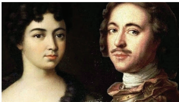
Пётр I и Мария Кантемир