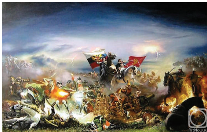
Пётр I и господарь Молдавии Дмитрий Кантемир в битве за Молдавию, с турками и татарами, 1711г.